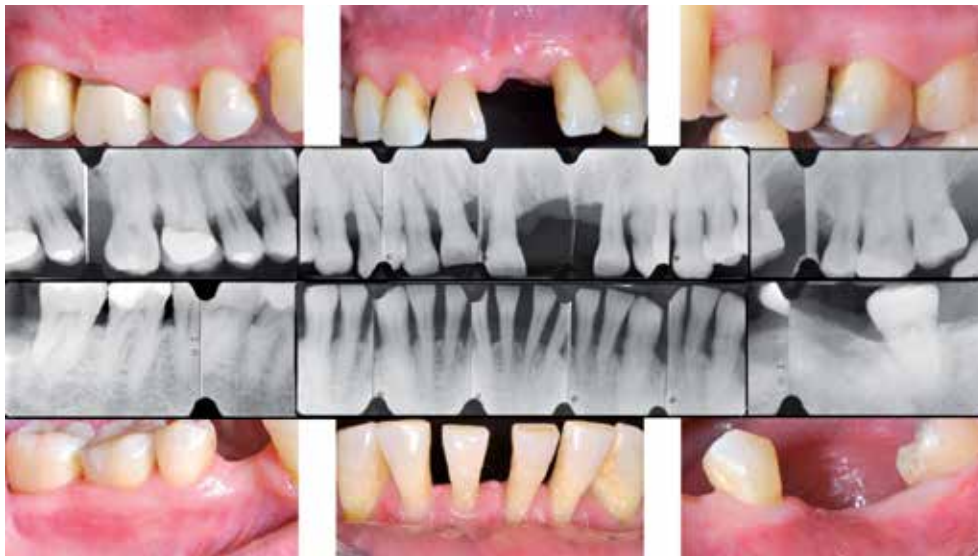
Figura 2. Radiografías perioapicales y fotografías basales.