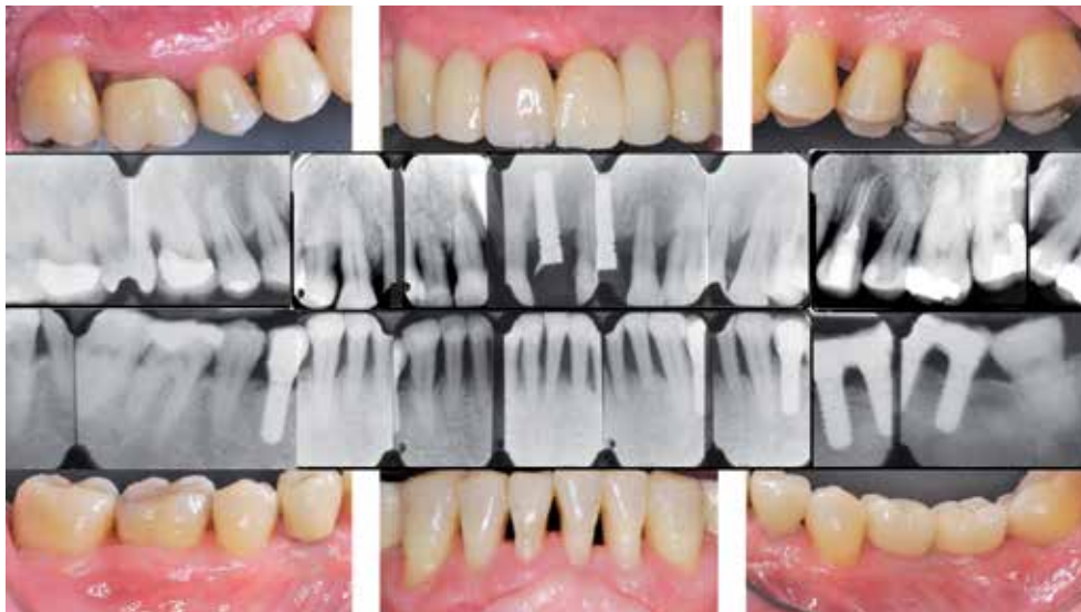
Figura 8. Radiografías periapicales y fotografías finales.

La relación de los márgenes gingivales de los dientes antero-superiores juega un papel relevante en la estética de la sonrisa. El contorno gingival debe seguir el perfil anatómico natural de la línea amelocementaria de los dientes, creandose un festoneado del tejido gingival que rellene los espacios interdentes. En pacientes con pérdida severa de inserción las discrepancias marginales son muy frecuentes, por lo que uno de los objetivos de la ortodoncia es conseguir un correcto alineamiento de los márgenes gingivales mediante movimientos leves de extrusión e intrusión (Jepsen y cols. 2015).