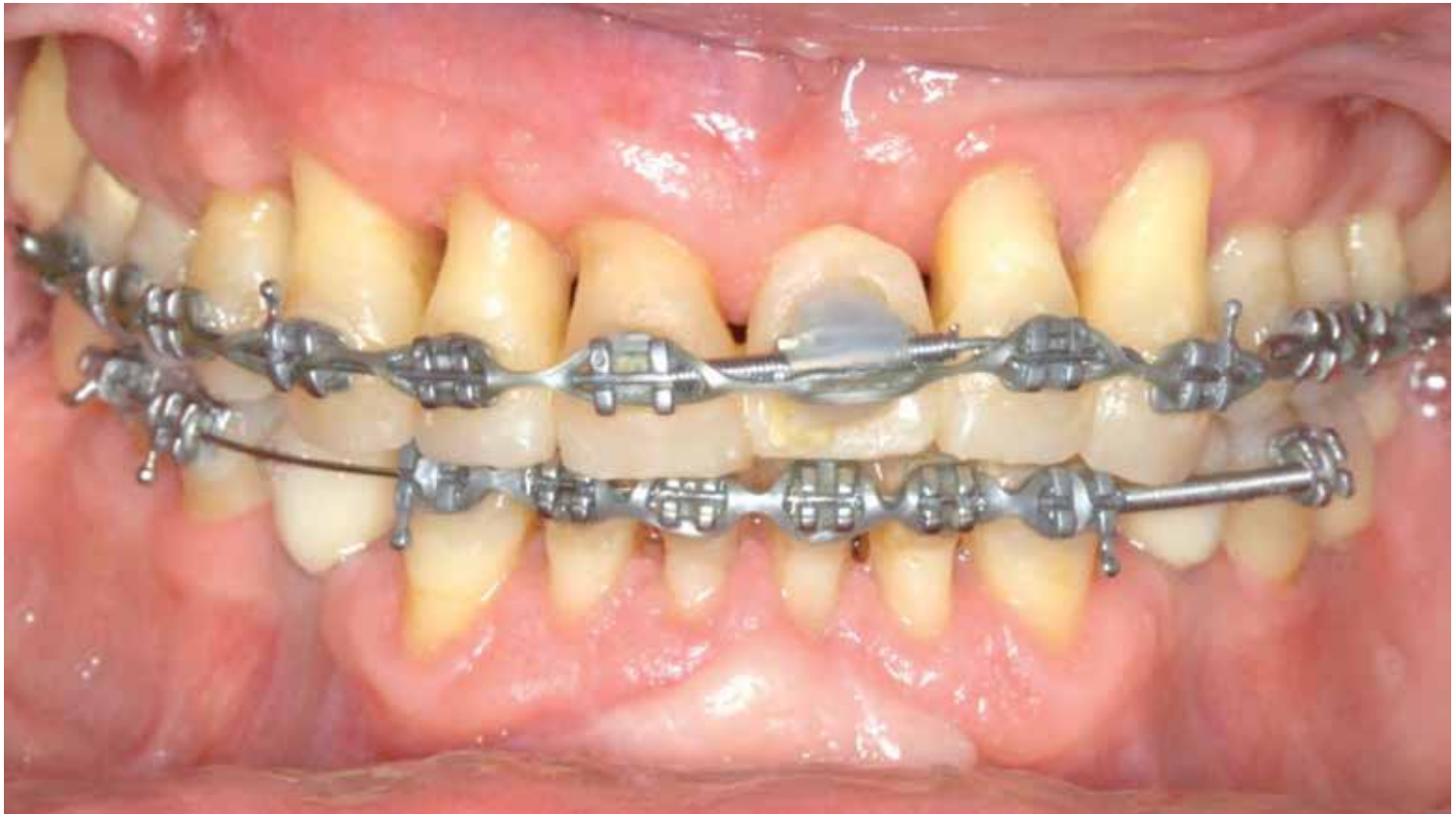
Figura 6. Final del tratamiento de ortodoncia.

El tratamiento de este complejo entramado anatómico y funcional requiere un abordaje interdisciplinar, comenzando por un tratamiento periodontal completo para eliminar la infección y la inflamación de los tejidos periodontales, y corregir los posibles defectos óseos localizados, seguido de la terapia ortodóntica y terminando con la restauración de la dentición perdida mediante la colocación de implantes dentales y/o restauraciones protodónticas [Figura 6]. En ciertas situaciones en las que exista una recesión localizada, se puede considerar la aplicación de técnicas mucogingivales de recubrimiento radicular previas al tratamiento ortodóntico.