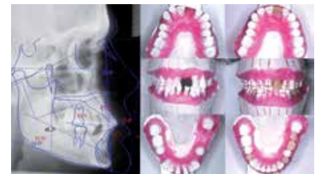
Figura 3. Diagnóstico ortodóntico con cefalometría y Set-up.