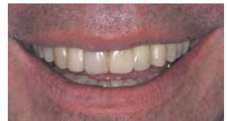
Figura 10. Foto de sonrisa tras el tratamiento interdisciplinar.