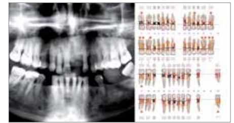
Figura 1. Diagnóstico periodontal con panorámica y periodontograma Basal.