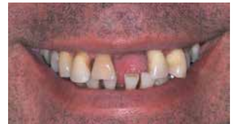
Figura 9. Foto de sonrisa en basal.