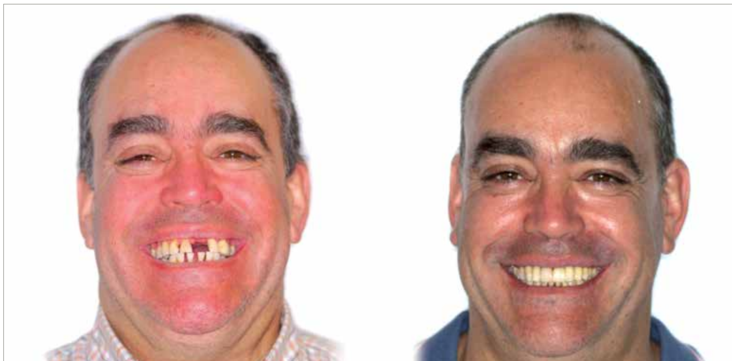
Figura 11. Cambio del paciente tras el tratamiento interdisciplinar.