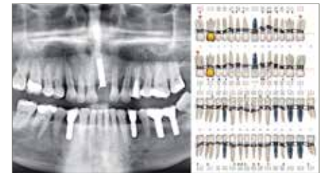
Figura 7. Diagnóstico periodontal con panorámica y periodontograma planificación restauradora.

Pese a la existencia de series de casos, casos clínicos y fundamentada experiencia clínica, falta evidencia científica para poder concluir cuál es el momento adecuado y la secuencia de tratamiento acertada en el tratamiento combinado periodontal y ortodóntico (Rossini y cols. 2015).